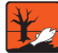
Pericoloso per l'ambiente