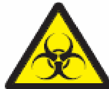
Pericoloso per l'ambiente