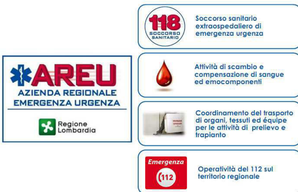
Figura 1 – La mission di AREU