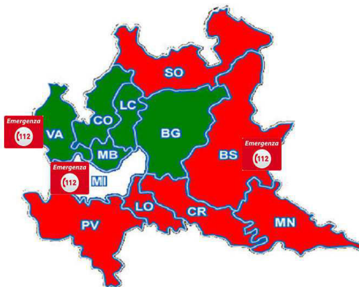
Figura 3 – Il NUE 112